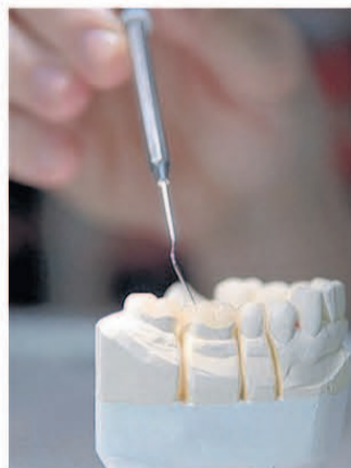
Zahnersatz wird im eigenen Meisterlabor gefertigt.

geschaltet. Vielmehr wird er durch die Gabe von Schlafmitteln sanft in einen Zustand des